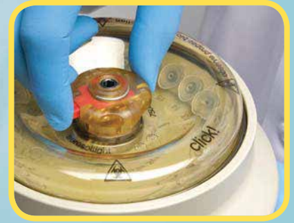
透明的 ClickSeal 防生物污染转头盖