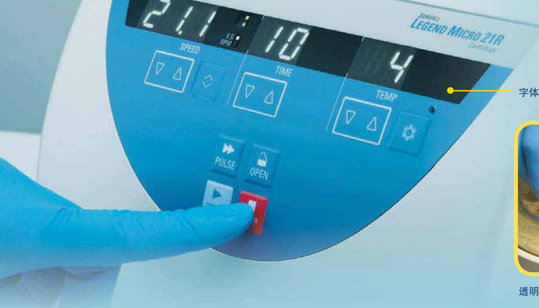
字体大，明亮醒目，易于观察的显示屏