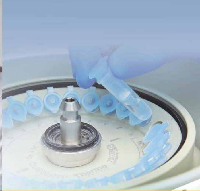
Thermo Scientific Sorvall Micro 17& 21 系列微量离心机