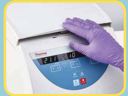
快速、一键实现转头盖的密封